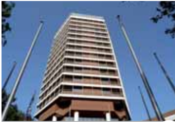
Sportschule Wedau 2