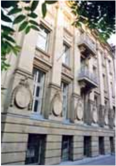
Folkwang Hochschule - Musikhochschule 1